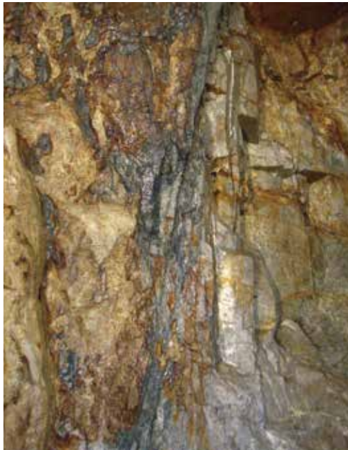
阿部鉱山採掘場内 ※グレーの色の部分だけが光明石として採掘されます。

岡山県の中央部にある高梁市の阿部鉱山で産出される光明石は1956年ウラン鉱脈探しの中、偶然発見されました。