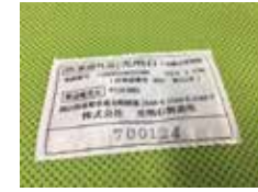
↑商品はすべてシリアル番号で管理しています。

BOXの形やメッシュ袋の色はカスタマイズが出来るので 販売店オリジナルの商品が可能です！