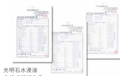
光明石水浸液 分析成績報告書 司生堂化学研究所