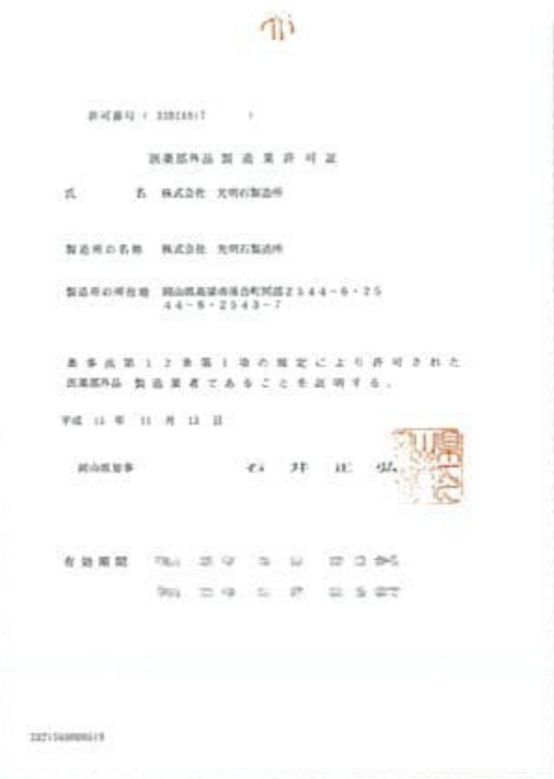
医薬部外品製造業許可証