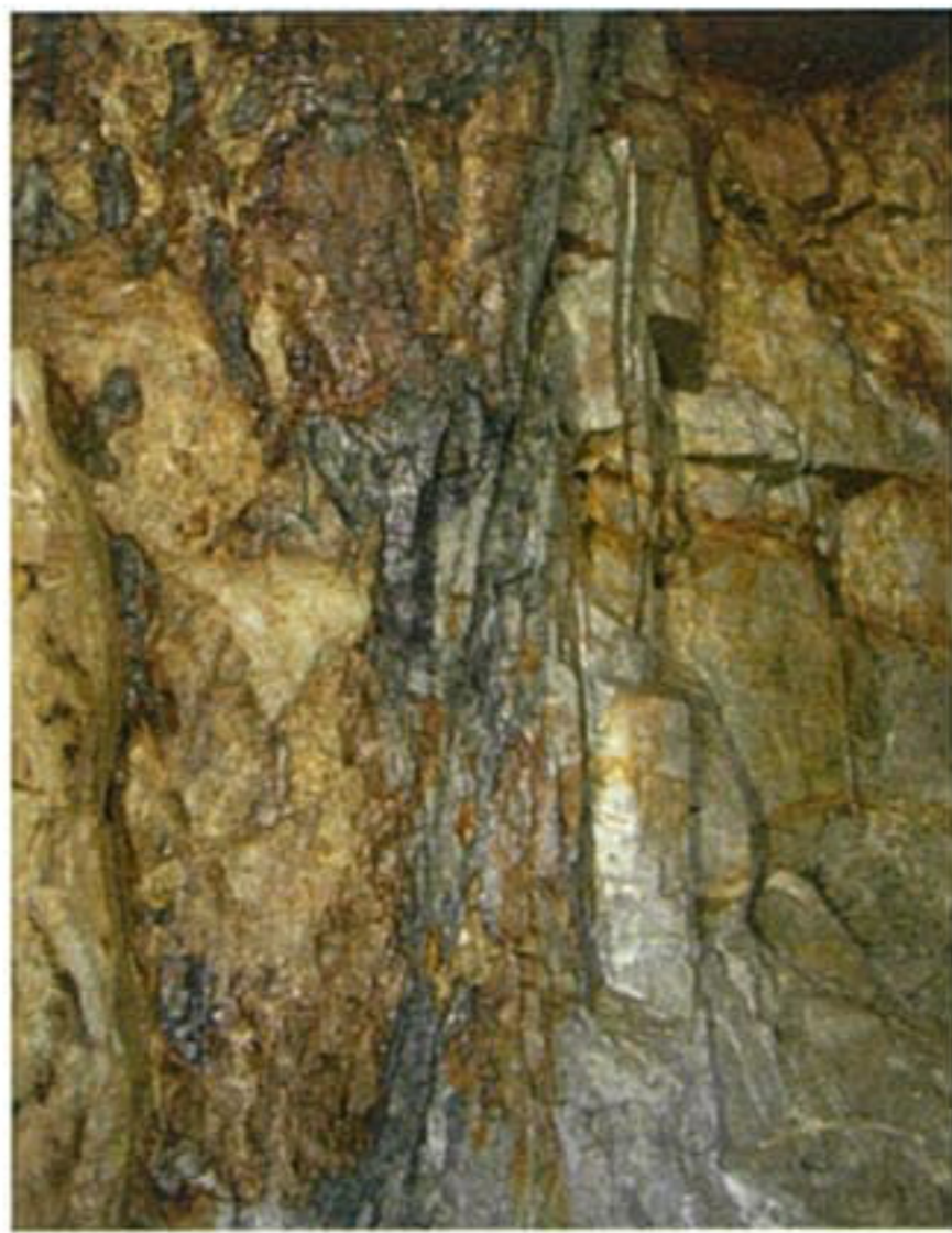
阿部鉱山採掘場内 ※グレーの色の部分だけが光明石として採掘されます。