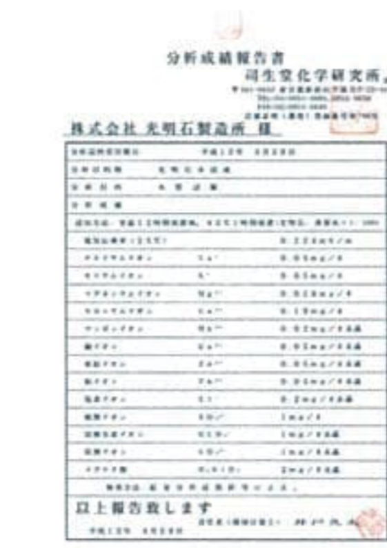
光明石水浸液 分析成績報告書 司生堂化学研究所